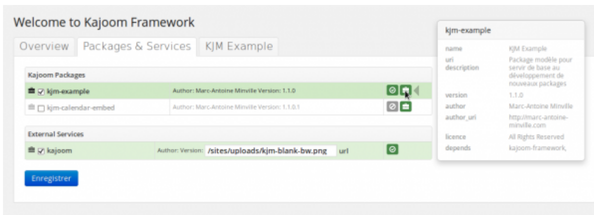
Onglet des Packages et Services du plugin Kajoom Framework.