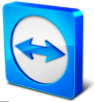
Logo de Teamviewer.

Lors de support à distance pour un problème relié à votre ordinateur, nous pouvons vous demander de télécharger et de démarrer le logiciel Teamviewer afin de vous aider à régler vos pépins rapidement, directement sur votre ordinateur.