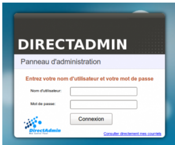
Formulaire de connexion à DirectAdmin