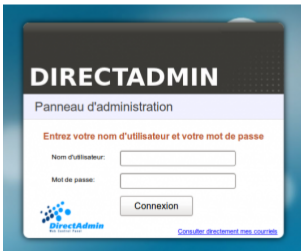
Formulaire de connexion à DirectAdmin